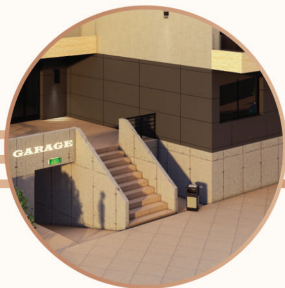
Pešački pristup objektu B

Pešački pristup objektu B predviđen je iz ulice Daničićeve, novoprojektovanom saobraćajnicom. Do nivoa prizemlja pristupa se ulaznim stepeništem, a omogućen je i direktan pristup garaži preko blage silazne rampe. Ovaj prilaz je prilagođen osobama sa invaliditetom koje tako mogu pristupiti liftu bez korišćenja stepenika, a koristi se i kao ulaz za vatrogasne intervencije.