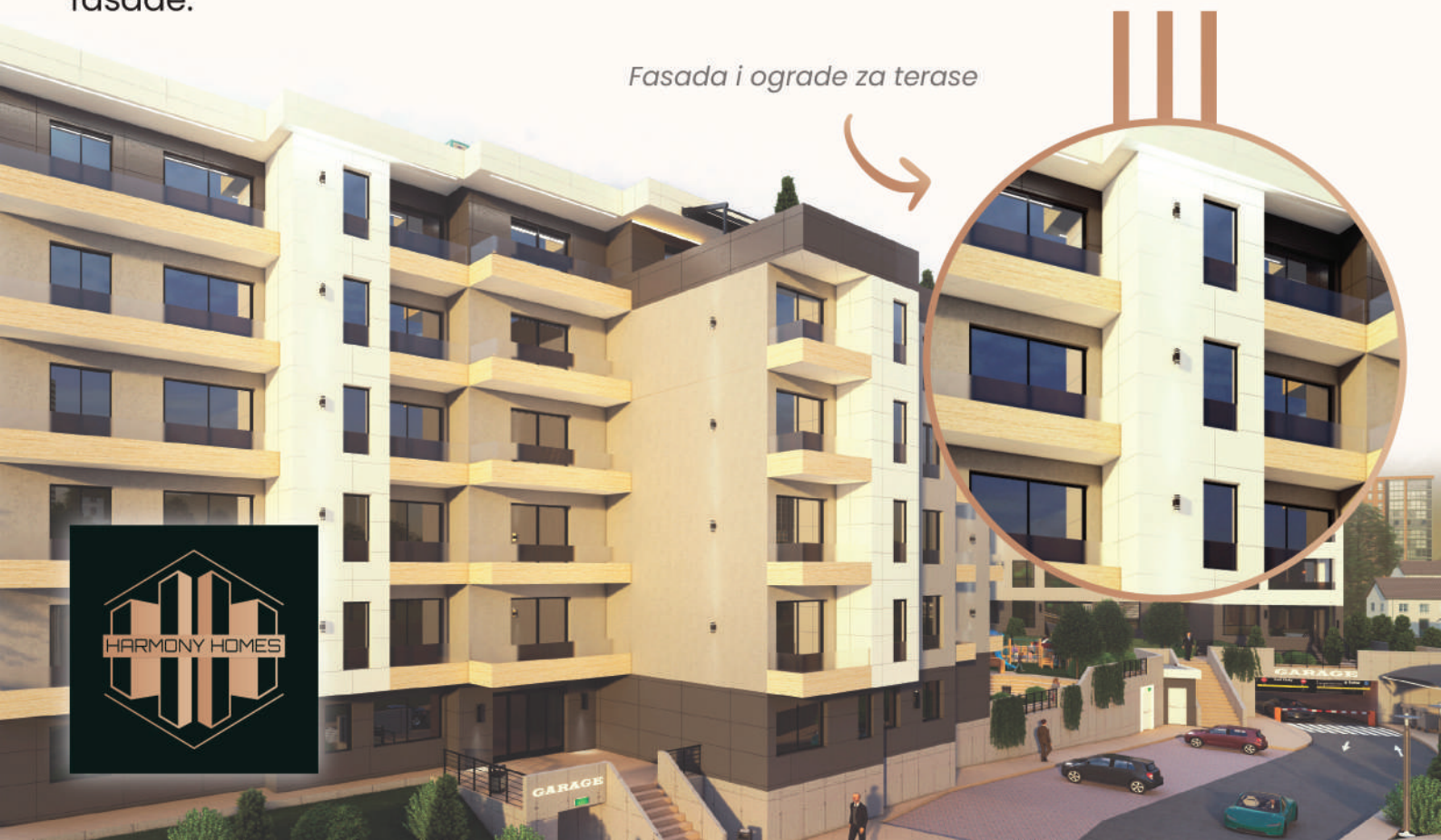
Fasada i ograde za terase

Terase na određenim fasadnim potezima, sa spoljne strane zidanog dela ograde su obložene fasadnim malterom u dekorativnoj "Travertino" ili "Beton" tehnici dok su ostale terase na objektima sa spoljne strane zidanog dela ograde obložene klasičnim fasadnim dekorativnim malterom kao i ostatak fasade.