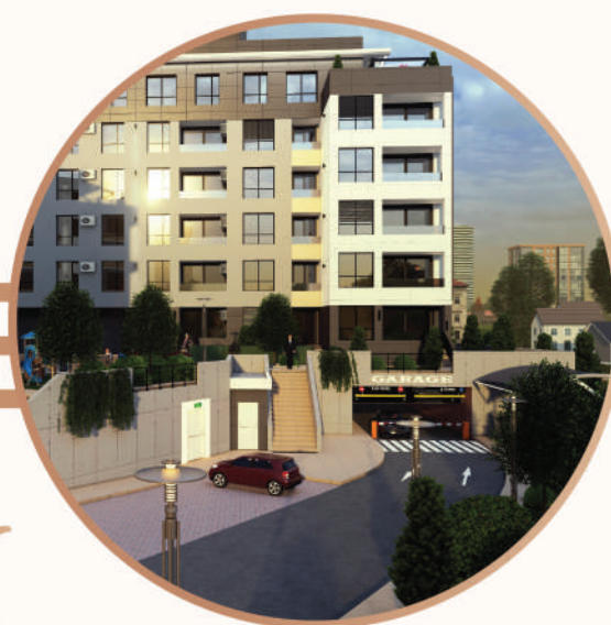
Pešački pristup objektu A